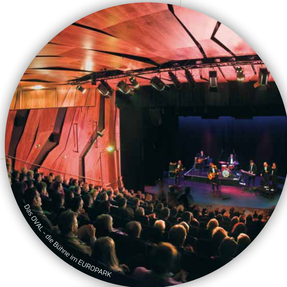
Das OVAL – die Bühne im EUROPARK

Neues und Beeindruckendes kreieren: Mit dieser Mission schaffen wir die besten Voraussetzungen für außergewöhnliche Shopping- und Genusserlebnisse.