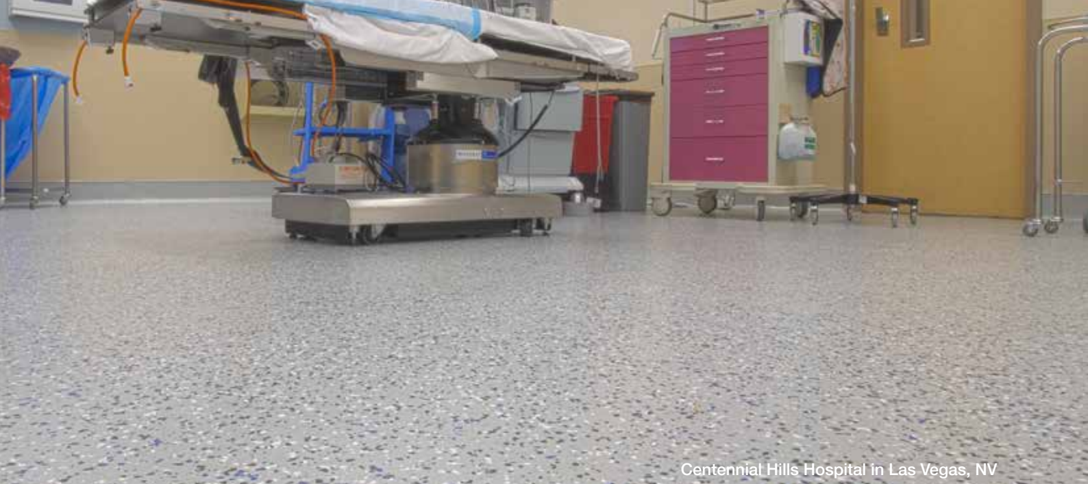
Centennial Hills Hospital in Las Vegas, NV