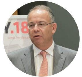
Heimo Scheuch Wienerberger