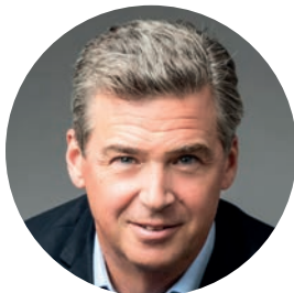
Andreas Gnesda Leitbetriebe Austria