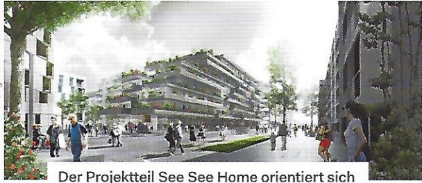
Der Projektteil See See Home orientiert sich vor allem an den Ansprüchen von Familien.